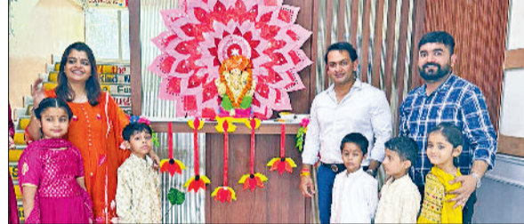
मिवानी। कार्यक्रम में पूजा अर्चना करते हुए।