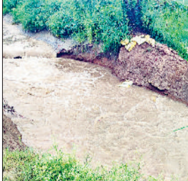
भिवानी। माइजर में आई दरार से बहता पानी व खेतों में जमा पानी दिखाते किसान।