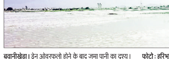
बवानीखेड़ा। ड्रेन ओवरफलो होने के बाद जमा पानी का दृश्य।