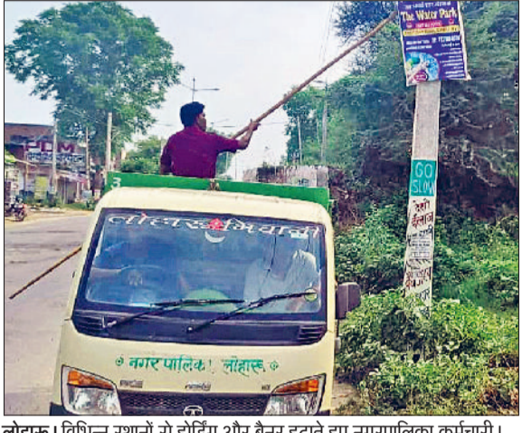
लोहाक। विभिन्न स्थानों से होर्डिंग और बेनर हटाते हुए नगरपालिका कर्मचारी।

पॉलिथीन के प्रयोग पर पूर्णतया रोकथाम सुनिश्चित करने के लिए लोगों की भागीदारी सुनिश्चित करें