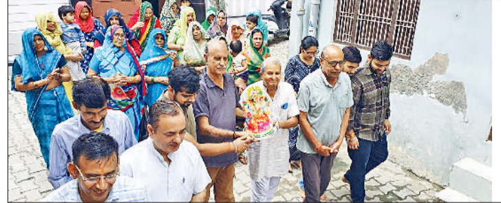
मिवानी। भगवान श्रीगणेश की प्रतिमा को स्थापित करने से पूर्व शोभायात्रा निकालते श्रद्धालु।