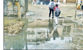
भिवानी। हरजीकान चौक पर नालों से बाहर सड़क पर फैली गंदगी।