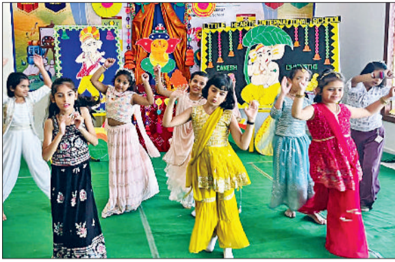
मिवानी। स्कूल में प्रस्तुति देते विद्यार्थी।