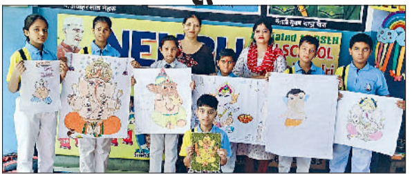
चरखीदादरी। भगवान गणेश की पेंटिंग बनाकर दिखाते विद्यार्थी।