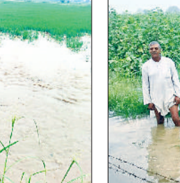
भिवानी। माइजर में आई दरार से बहता पानी व खेतों में जमा पानी दिखाते किसान।