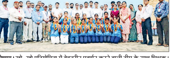
तोशाम। खो-खो प्रतियोगिता में बेहतरीन प्रदर्शन करने वाली टीम के साथ शिक्षक।

2 लाख रुपए नगद पुरस्कार तथा निशुल्क हवाई यात्रा पाने से मात्र एक कदम दूर आदर्श इंस्टिट्यूट कैरू के खिलाड़ी