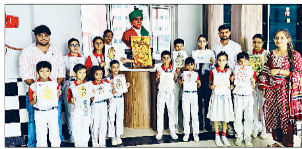
चरखीदादरी। भगवान गणेश की पेंटिंग बनाकर दिखाते विद्यार्थी।